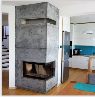
Hajduk Volcano 2P – wkład kominkowy firmy Hajduk w zabudowie imitującej beton architektoniczny – imitacja wykonana za pomocą stiuku woskowanego. Dzięki temu powierzchnia kominka jest nieporowata i łatwa w utrzymaniu. Wykończenie ramy oraz wylotu powietrza i cokołu ze stali nierdzewnej szczotkowanej.